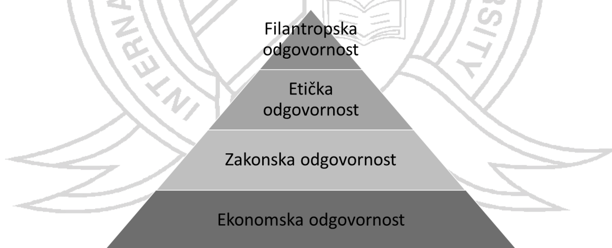
Slika 1 Piramida društveno odgovornog poslovanja

Jedna od najčešće upotrebljivanih definicija za društveno odgovorno poslovanje jest ona koju su upotrijebili Kotler i Lee (2009), a ona glasi kako je društveno odgovorno poslovanje predanost poboljšanju dobrobiti neke društvene zajednice kroz pružanje korporativnih resursa, odnosno kroz provođenje korporativnih društvenih inicijativa koje podupiru socijalne ciljeve. Za razliku od Kotlera i Lee (2009), Hopkins (2006) definira društveno odgovorno poslovanje kao etičan odnos prema zainteresiranim stranama unutar i izvan organizacije s ciljem očuvanja profitabilnosti te postizanja visokih životnih standarda za sve zainteresirane strane. Društveno odgovorno poslovanje definirano je na brojne načine, no svaka definicija naglašava kako ono mora biti usmjereno ka pomaganju društvenoj zajednici. Ove definicije naglasak stavljaju na društvenu dimenziju koncepta održivog razvoja, no kako je društveni segment u međuovisnosti s ostala dva segmenta, ona se također moraju uvažiti prilikom planiranja društvene odgovornosti. Prema tome, moguće je govoriti o društveno odgovornom poslovanju, koje najprije treba ostvariti ekonomsku održivost, a posljedično tome onu društvenu i ekološku. Ova teza se potvrđuje i kroz tzv. Piramidu društveno odgovornog poslovanja, koju je 1991. godine postavio Carroll, a koja je prikazana na sljedećem prikazu.