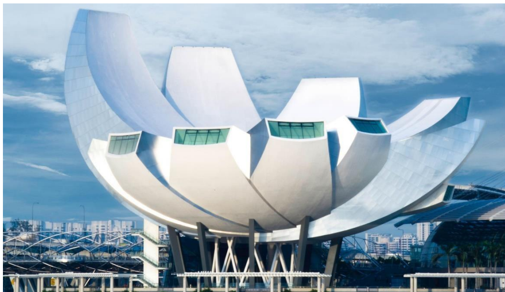
Slika 3 ArtScience Museum u Singapuru

planiran stalni postav, u muzeju se uglavnom održavaju putujuće izložbe čiji su kustosi drugi muzeji. Arhitektura muzeja osmišljena je tako da ujedinjuje discipline umjetnosti i znanosti. Muzej umjetnosti Marina Bay Sands estetski je ugodan i inovativan u građevinskoj tehnologiji. Često poznat kao "ruka dobrodošlice Singapura", muzej utjelovljuje oblik lotosovog cvijeta s organskim dizajnom. Ima okruglu bazu koja je ugrađena u zemlju i okružena vodom zaljeva. Deset prstiju ili latica izlazi iz središta, šireći se u veličini i visini kako bi stvorili četiri kata galerijskog prostora, budući da vrhovi prstiju dopuštaju pokrivače za prirodna izložbena rasvjeta. Nadalje, latice u obliku tanjura usmjeravaju kišnicu do središnjeg atrija, omogućujući skupljanje i recikliranje kišnice, čineći muzej vrlo ekološki prihvatljivim i održivim. U muzej se ulazi kroz samostalni stakleni paviljon. Velika dizala i pokretne stepenice prevoze publiku do donjih i gornjih galerija. Ukupno postoje tri razine galerija ukupne površine 6000 četvornih metara. Asimetrična struktura muzeja, koju je zamislio Arup, seže do horizonta na visini od 60 metara i podupire je složena čelična rešetkasta struktura. Ovaj sklop podupire deset stupova i u središtu je vezan dijamrežom nalik na košaru — skulpturalnim središnjim dijelom koji prihvaća asimetrične sile koje stvara oblik zgrade. Rezultat je učinkovito rješavanje strukturalnih sila za zgradu, dajući joj naizgled bestežinsku kvalitetu dok lebdi iznad tla.