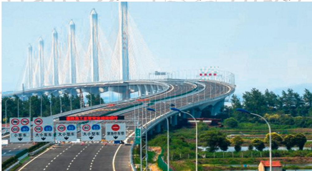
Slika. 2. Savremeni most izgrađen na osnovu znanja i savremenih tehnologija