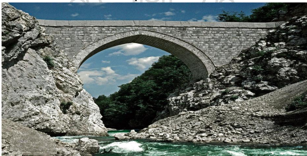
Slika 1. Most iz perioda osmanske vladavine