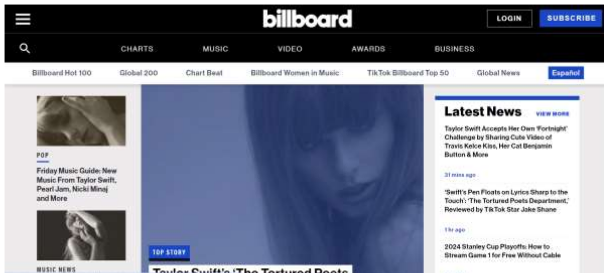
Slika br. 3

Časopis moženo okarakterisati sa 4 rupbrike: upfront, glilvni članak, muzika i grafikoni.