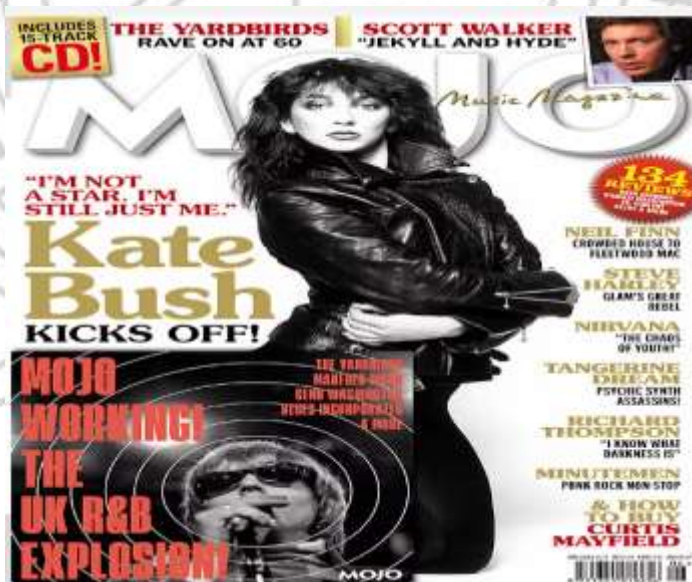
Slika br.

MOJO je popularni muzički časopis koji izlazi jednom mjesečno u Velikoj Britaniji. Fokusira se uglavnom na klasičan rok, ali i druge teme. Ima elektronsku verziju i veb stranicu. Svaki broj ovog časopisa dolazio je sa CD-om koji je bio povezan sa jednim od članata u časopisu. MOJO izlazi od novembra 1993 godine. Nemenjen je svakoj generaciji jer obrađuje teme koje su svima zanimljive.