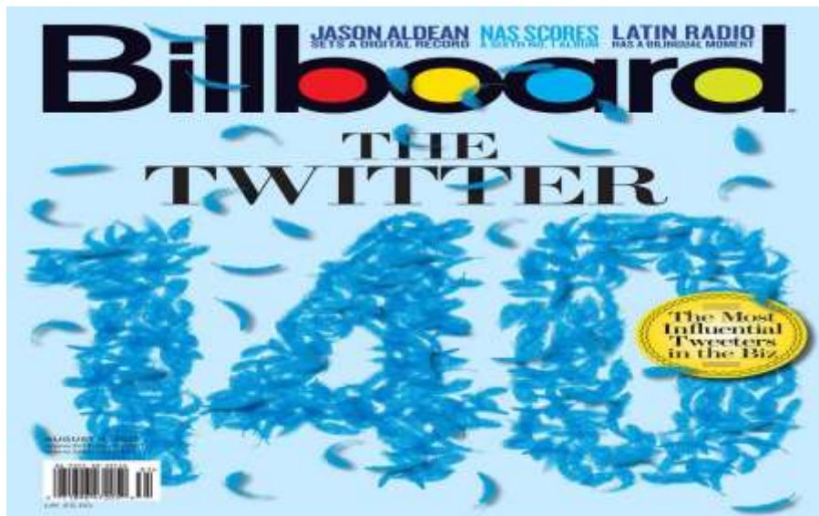
Slika br. 2

Na naslovnoj strani, u gornjem djelu, nalazi se naziv časopisa koji je ispisan sans serif pismom. Šupljine svih slova osim prvog ispunjene su bojom (crvena, žuta, plava i zelena). Kao u nekakvom okviru, u prostoru između gornjih produžetaka slova „b“ i „d“, nalaze se 3 naslova ispisan sans serif geometrijskim pismom i suptilnim nijansama plave boje koja odgovara na pozadini.